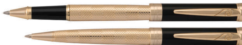
نیمه مشکی طلایی