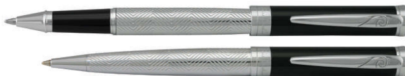
نیمه مشکی استیل