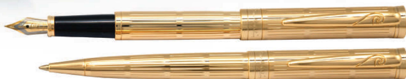
طلایی، نوک خودنویس روکش طلای ۱۸ عیار